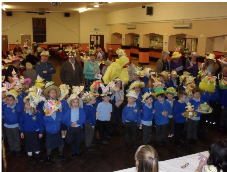
Ysgol Dolau showing how to do it.

Your Branch event could be here. Just send in the details.